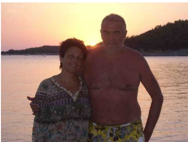
il tramonto e' una favola.....