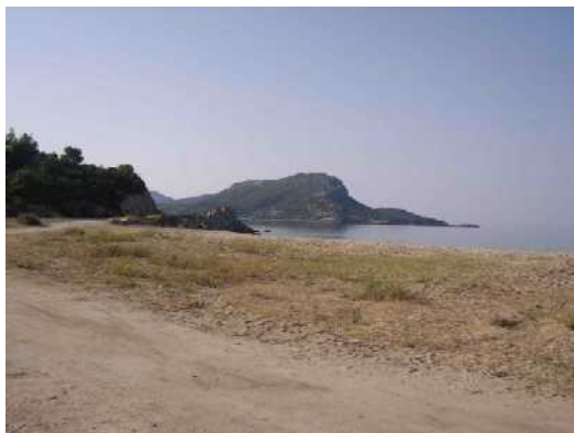
Port Koufo da Toroni