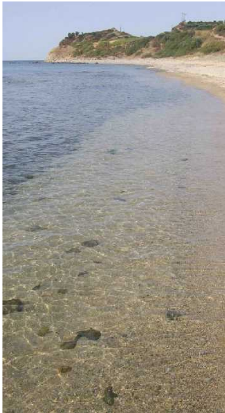
NEA PERAMOS....la spiaggia