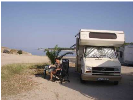
il solito Frappe' chiacciato per favore.....