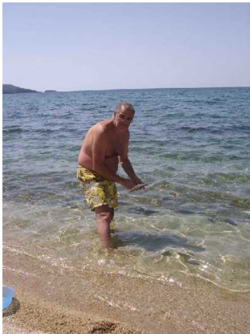
.....la pulizia del pesce (che frittura ragazzi)