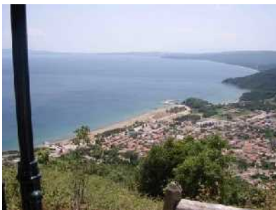
IERISSOS BAY ( paese di Stratoni)

Che dire !!! dopo un paio di giorni di completo relax , decidiamo di partire verso le tre dita ...la strada costiera (nei primi chilometri dopo Nea Peramos) e' un vero spettacolo di spiagge bianche e mare blu'.....Snoopy con la tranquillita' tipica di un diesel aspirato procede senza scosse , superiamo Eleochori-Loutra-Kariani sulla nuova autostrada dalla quale usciamo ad ASPROVALTA....(che caos)....e prendiamo la direzione per IERISSOS