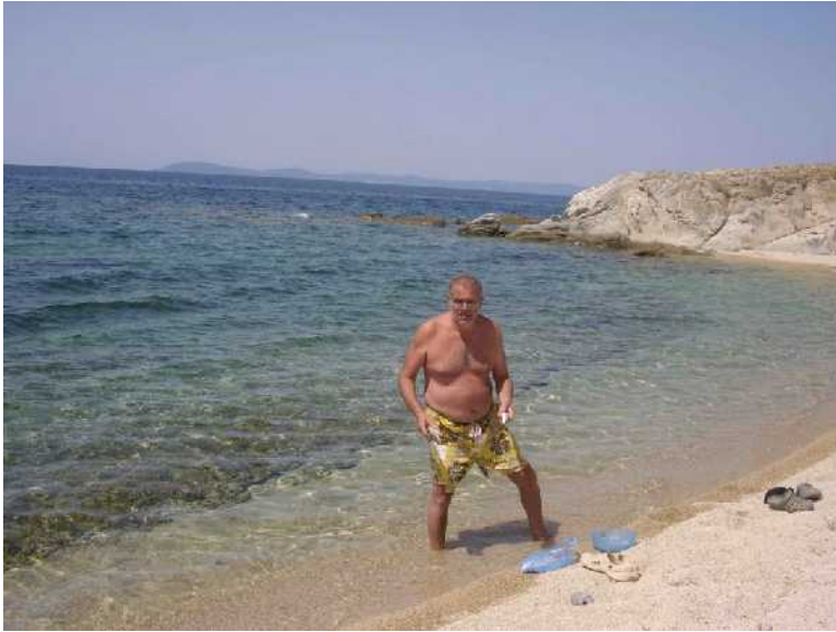
e lo splendido mare di Toroni.....