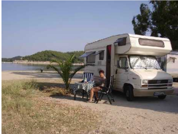
L'area di sosta ....