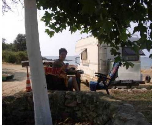
SNOOPY & SWEETY