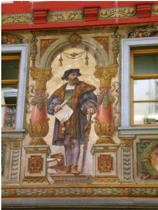
Stein am Rhein