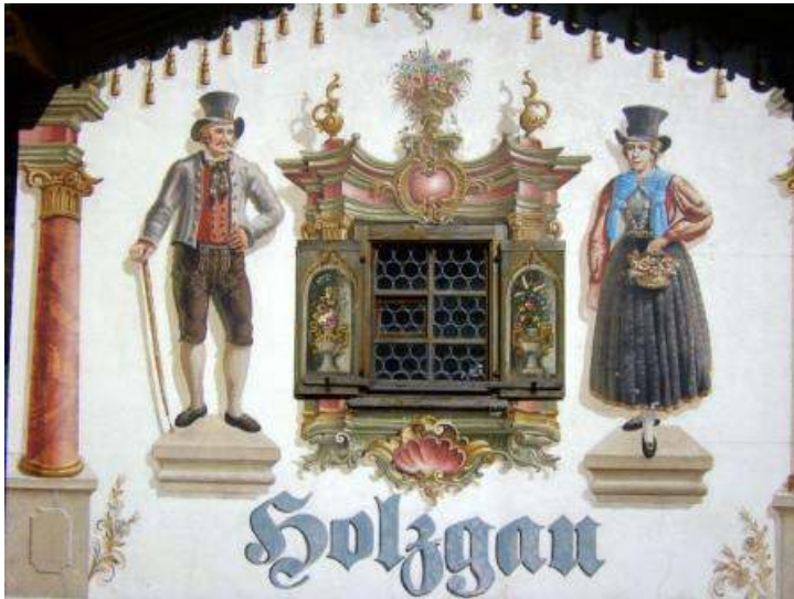
Il benvenuto "dipinto" ad Halzgau

Decidiamo di non fermarci a visitare Ravensburg, che, tra l'altro è sede della nota omonima casa costruttrice di puzzle e giochi di società o di ruolo. Girando intorno al centro per uscire dalla città possiamo apprezzare una cittadina graziosa, ma noi vogliamo dirigerci verso le montagne austriache per fare un giro del Voralberg e del Tirolo alla sinistra di Innsbruck che tante volte abbiamo progettato di vedere, senza mai riuscirci.