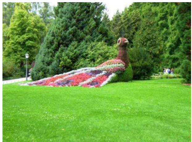
Isola di Mainau

Mainau è un parco di bellissimi giardini, grandi e ben tenuti; molti giochi per bambini, anche con acqua (portare per loro il costume da bagno) ma visita piacevole anche per grandi. Il prezzo ci sembra giustificato dalla necessaria incessante manutenzione. Ma il clou del parco è la splendida casa delle farfalle. In una serra di piante tropicali, umidissima e calda, centinaia di farfalle di tutti i tipi e dimensioni, volano dappertutto, si fermano e sembra che si mettano in posa per la foto di rito. Pranzo frugale nel ristoro della casa delle farfalle e ripartiamo per Costanza. Cerchiamo il Parcheggio Dobele (citato in numerosi diari) che infatti è ben indicato e inaspettatamente vicinissimo al centro; ha un CS scomodissimo e non abbiamo potuto verificare se il carico è funzionante (alcuni diari dicono che non c'è carico, ma almeno la struttura del CS come gli altri della zona c'è). Il costo è 1 € l'ora. Usciamo con sole e caldo e ritorniamo che sta iniziando un temporale.