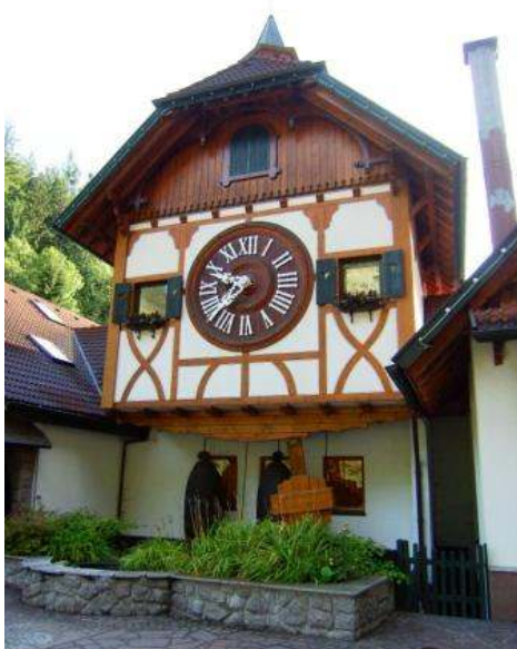
Il più grande orologio a cucù del mondo (dintorni di Triberg)

Nota: appena all'ingresso del paese, sulla sin è indicato un parcheggio (P6) per bus con orario 8/19 ma lo stesso parcheggio, in parallelo alla strada, oltre i posti per i bus, riserva 3/4 posti ai camper (cartello "nur", che vuol dire "solo" e simbolo camper, poco visibile dalla strada) un po' in pendenza, ma noi abbiamo messo i cunei (visto che eravamo "regolari"), inoltre anche i posti bus possono essere utilizzati per la notte visto che dopo le 19 non sono più riservati ai bus. Non ci sono servizi ed è gratuito. Al centro del paese c'è anche il P3 (gratuito), riservato ai camper anche questo senza servizi: si tratta di 5 "box" coperti, che si raggiungono svoltando a sin alla chiara e visibile indicazione e proseguendo oltre il P per le vetture (che potrebbe trarre in inganno) per ca. 200 m. Noi non ci siamo fermati lì perché volevamo vedere la tv con l'antenna satellitare.