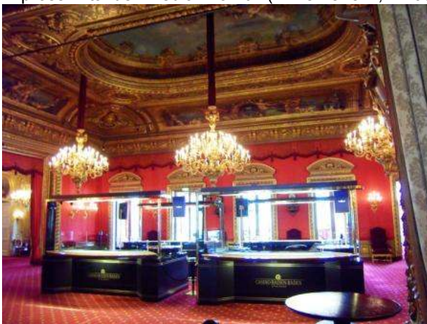
Il Casinò di Baden Baden

Nota: la nuova AA ha con piazzole in brecciolino, colonnine dell'elettricità, CS del tipo Sanitary Station con carico a pagamento e griglia acque grigie. Si trova ridosso della B500, precisamente in Hubertstrasse, in prossimità del Media Markt (N 48.78252°, E 008.20340°). Per chi arriva dall'autostrada ci sono le