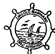
Circolo Marinaro dell'Adriatico