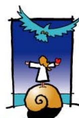
il Falco Azzurro