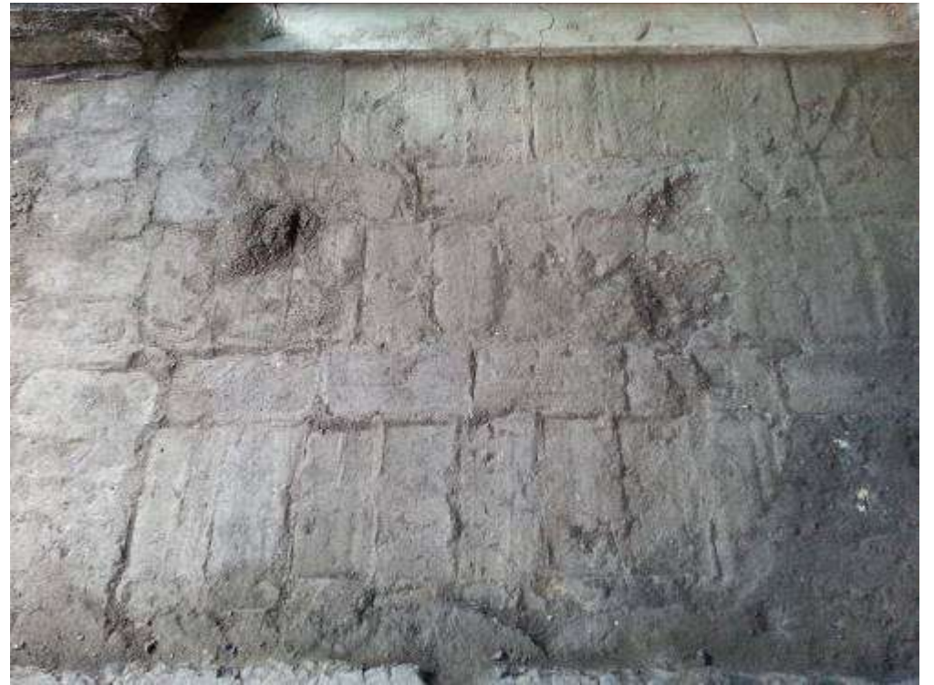
Fotografie della pavimentazione originale del XIII secolo trovata sotto a quella presente prima dell'inizio dei lavori.