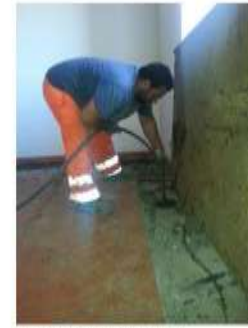
Iniezione del micropalo