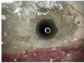
Dettaglio micropali prima del getto