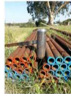
Armatura del micropalo

Armatura di micropali effettuata attraverso la fornitura e posa in opera di barre dywidag in acciaio Bst500s secondo la DIN 1045-1:07/2011 filettati e con manicotto diametro esterno nominale 51 mm, diametro medio interno 33 mm.