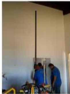
Armatura del micropalo prima del getto