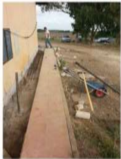
Dettaglio micropali prima della realizzazione dell'armatura del cordolo di coronamento