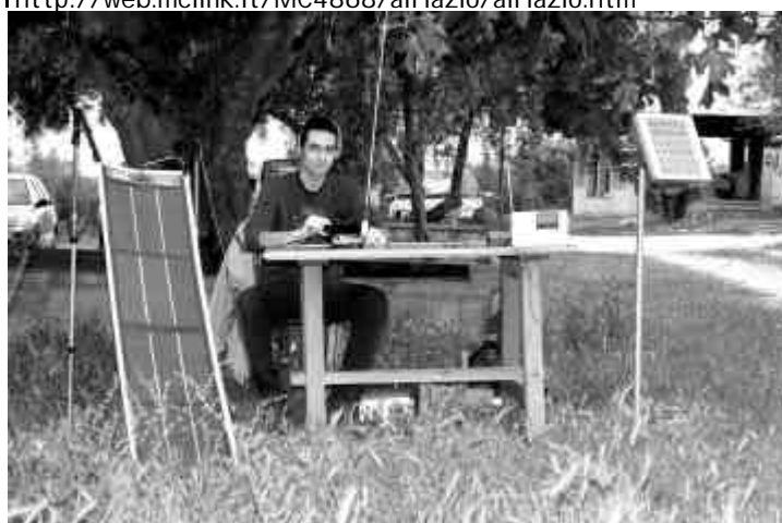
2008 Vetralla - Esperimenti con pannelli solari

http://web.mclink.it/MC4868/airlazio/airlazio.htm