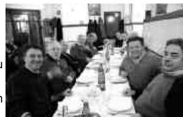
2008 Roma Radiopizza componenti AIR Lazio

Per iniziare dagli eventi più modesti, le radio pizze sono state per me, oltre che un lieto momento conviviale, un