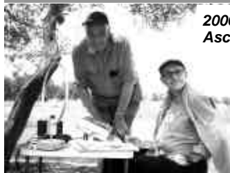
2006 Vetralla - Dx Camp Ascolti con loop AOR e il Sangean 818