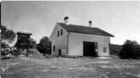
1998 Vallepietra - Dx Camp Rifugio Capanno Trilli: meta dei nostri DX Camp

Tale fondazione è avvenuta nel 1994 e in data 29 aprile 1995, al Teatro Vittoria di Roma, in collaborazione con il Gruppo "RANCH radio anch'io" e la FIR CB "Roma 81" si tenne un incontro sul tema dell'hobby del radioascolto e sull'attività pratica per dargli maggiore impulso: ascolto organizzato (anche in gruppo), visite ai musei tecnico - scientifici, giornate di radioascolto da effettuarsi in montagna (Vallepietra) e così via. Tutte attività che sono state poi puntualmente svolte! I partecipanti all'incontro sono rappresentati nella foto pubblicata in copertina di questa rivista.