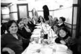
2008 Roma Radiopizza con mogli al seguito