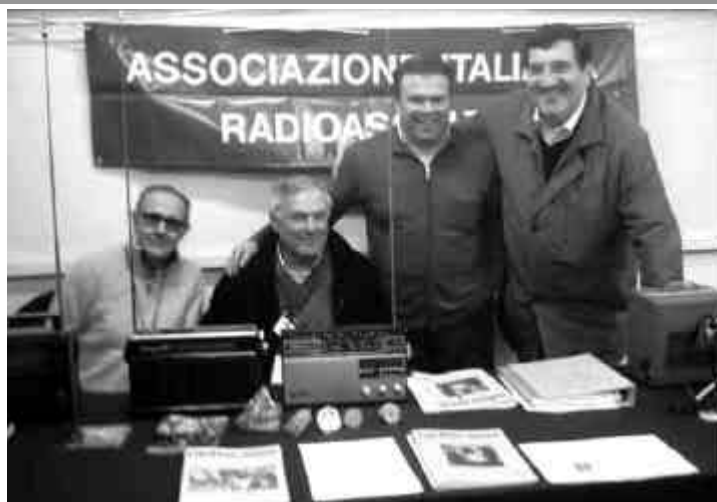
2007 Roma - Fiera Radio Elettronica Postazione AIR al Palacavicchi di Ciampino