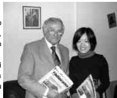
2004 Roma Incontro con la delegazione di Radio Cina Internazionale

Solo ad alcuni di essi ho potuto prendere parte, ma, scorrendo l'elenco sul sito AIR Lazio - Attività, mi sono reso conto che po' po' di attività radio sia stata svolta in questi anni nel Lazio, più Formia.